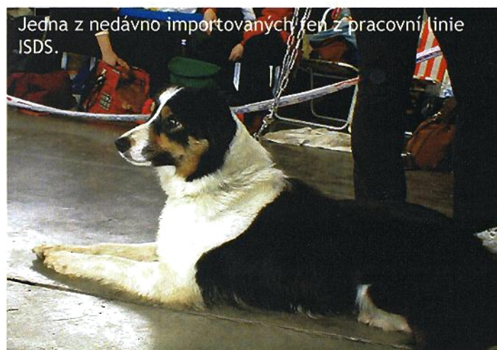
Jedna z nedávno importovaných fen z pracovní linie ISDS.