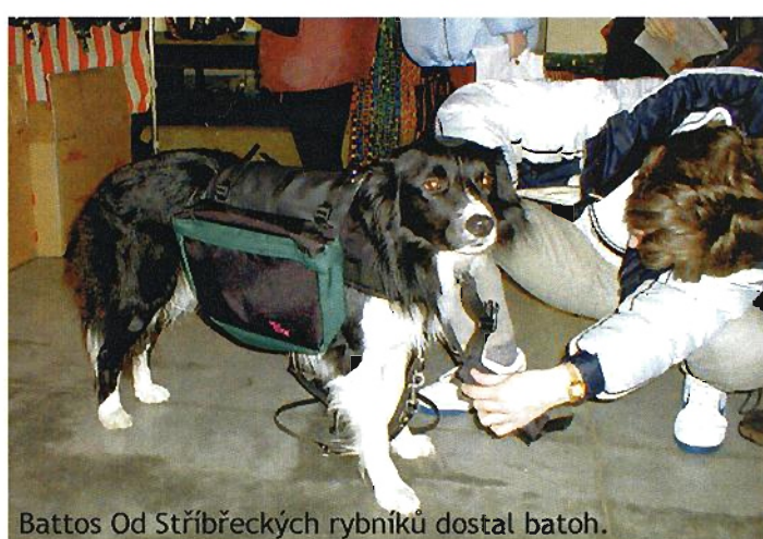
Battos Od Stříbřeckých rybníků dostal batoh.