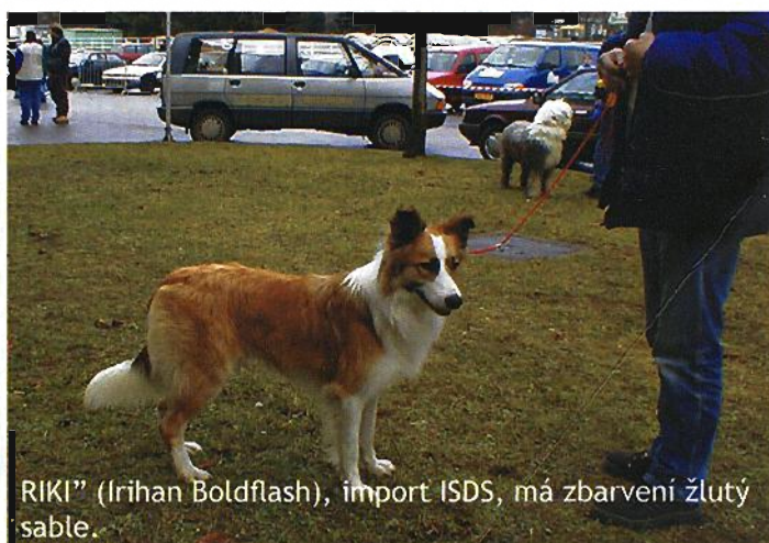
RIKI" (Irihan Boldflash), import ISDS, má zbarvení žlutý sable.