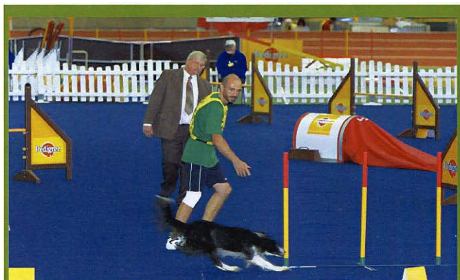
Závodník z Lichtenštejnska měl dobře natrénovaný náběh do slalomu, pes se téměř zastavil.