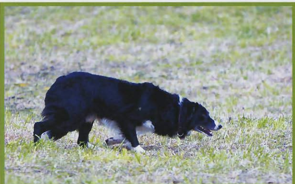
Studie border collie při práci (pes Williho Klaffla).