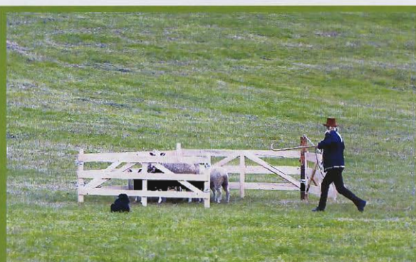
Dokud není brána zavřena, ještě není konec.