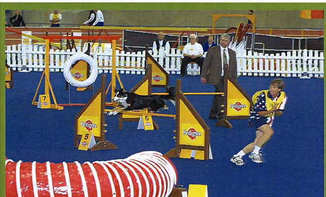
Tam ne, ke mně! Občas byly na trati záludnosti.