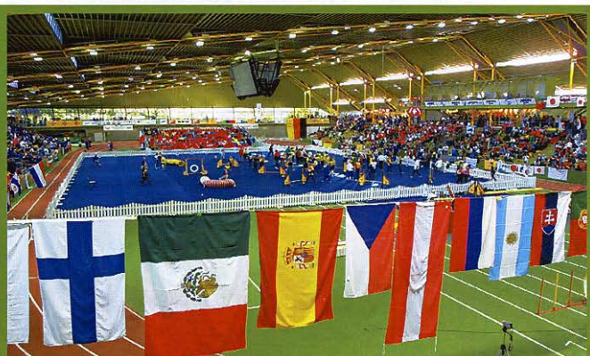
Mistrovství světa v agility v Dortmundu po třech letech a opět za účasti borců z ČR.