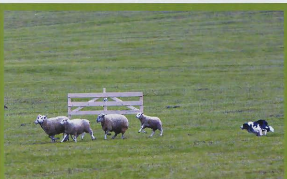
Ovce se občas rozhodly utéct domů. Bylo třeba je rychle dohnat.