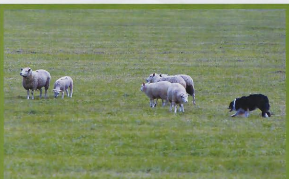
Občas si ovce postavila hlavu a nechtěla se hnout.