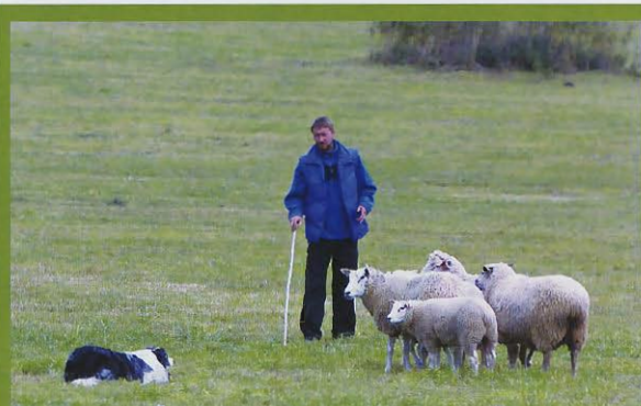
Host z Polska se umístil na hezkém čtvrtém místě.