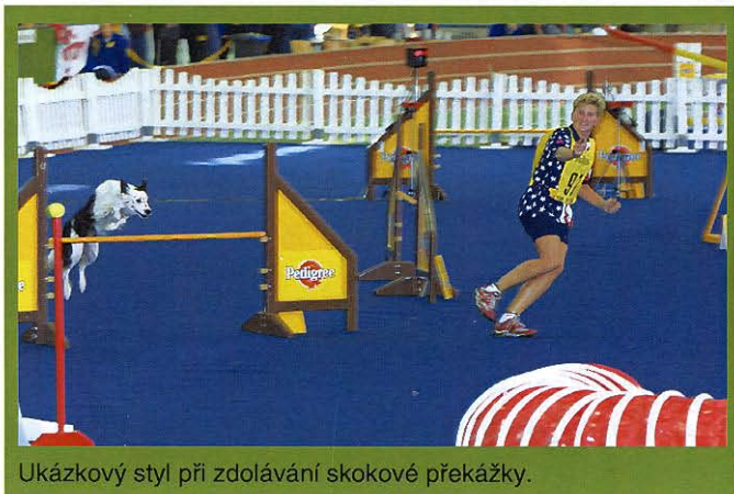
Ukázkový styl při zdolávání skokové překážky.