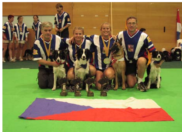
MS 2003 - Lievin